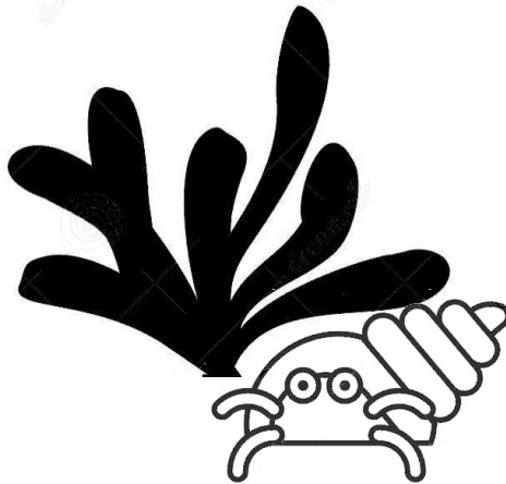
(l'anémone et le Bernard l'ermite)

Entre les deux, 20 siècles d' histoire linéaire dont il faut nous ressaisir organiquement.